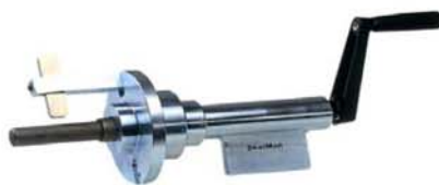
L'outil SKALMAN "équipé"

Outil très robuste pour le dénudage des tuyaux tressés et nappés du 1/2"-5/8"-3/4" -1"-1"1/4. Un outil complet est composé d'un Porte-Outil avec un Bras (A), d'une Pige de Centrage (B) et d'un couteau de dénudage extérieur (D). Le Kit Eco est composé d'une pige (B) par diamètre et d'un couteau de son support (D) et (A) pour les diamètres 1/2"-5/8"-3/4" -1" et pour le diamètre 1"1/4" d'un porte-Outil (A) différent avec un Bras (C) plus long et de la pige 1"1/4.