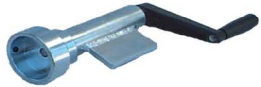
L'outil SKALMAN "nu"