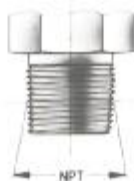
Exécution NPT (ASA B2.1.1960)